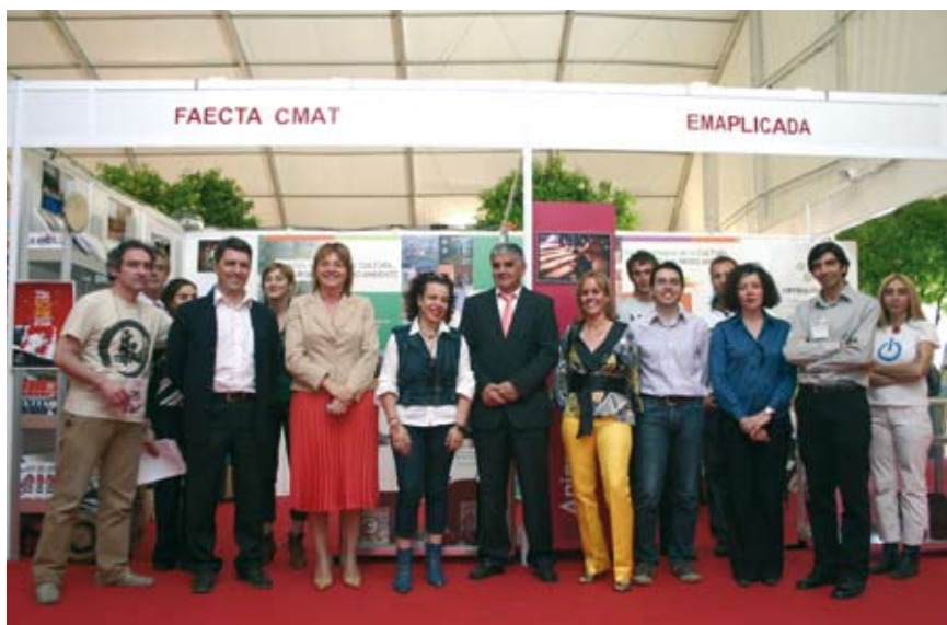
Representantes de FAECTA- CMAT y FAECTA-Sevilla junto a autoridades locales y cooperativistas

Nuestro objetivo ha sido darnos a conocer como grupo empresarial que gestiona integralmente la cultura, el turismo y el medio ambiente, cumpliendo así una de las líneas estratégicas del sector: visualizar la solidez del sector cooperativo en materia cultural, ambiental y turística en Andalucía y servir de plataforma de diversificación de servicios para nuestras cooperativas, generando servicios integrados entre nuestras empresas con el fin de mejorar la competitividad en este un mercado emergente.