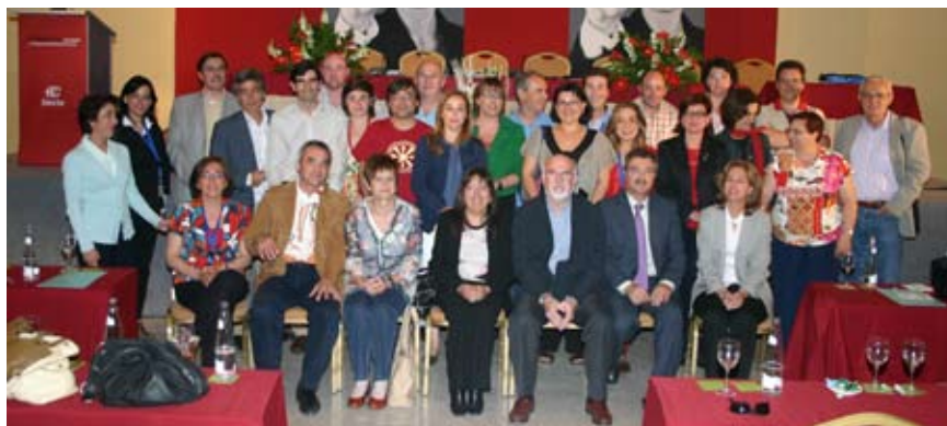
Integrantes del nuevo Consejo Rector, con mayoría de mujeres