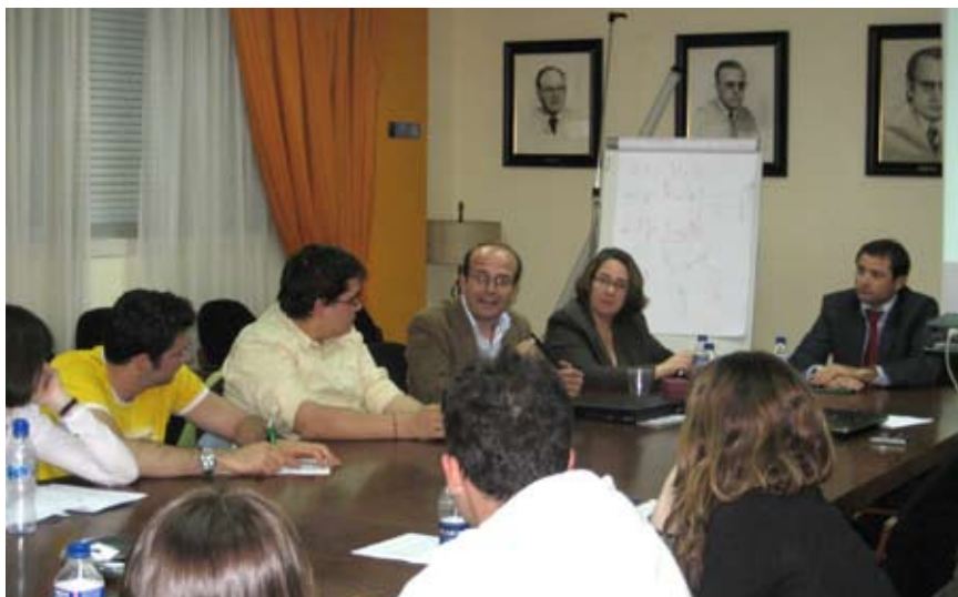
El presidente de FAECTA-Málaga participa en la mesa redonda sobre innovación

El día 2 de abril FAECTA-Málaga asistió al quinto aniversario del Centro Municipal de Empresa (CME) dependiente de Promálaga (Empresa Municipal de Iniciativas y Actividades Empresariales de Málaga). En este acto, presidido por el Alcalde de Málaga, Francisco de la Torre, se congregó a todos los agentes relacionados con la promoción empresarial y el empleo de la capital malagueña, se hizo balance de la gestión realizada