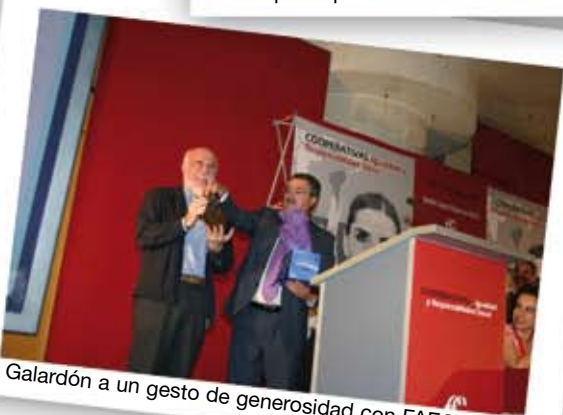
Galardón a un gesto de generosidad con FAECTA