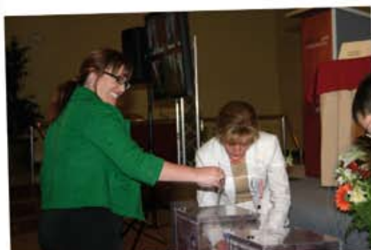
Cooperativistas deciden con su voto