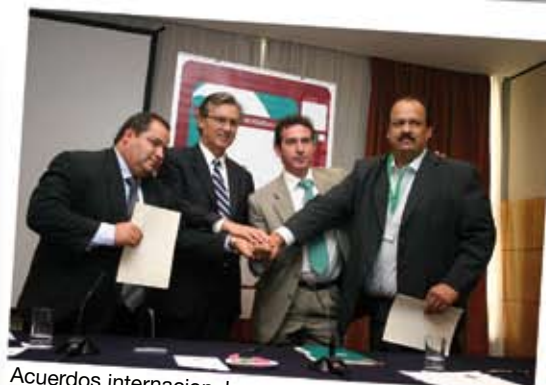
Acuerdos internacionales en Sevilla