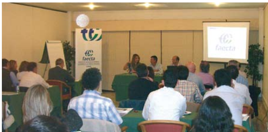
Formación de cooperativistas en Jerez

Todo ello a la espera de los cambios que se hayan de producir en la normativa estatal en la reforma de la Ley de Régimen Fiscal para Cooperativas y en la normativa autonómica con las modificaciones que están previstas en la Ley de Sociedades Cooperativas Andaluzas.