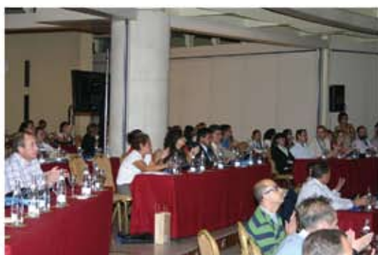
Alta participación en la asamblea de FAECTA