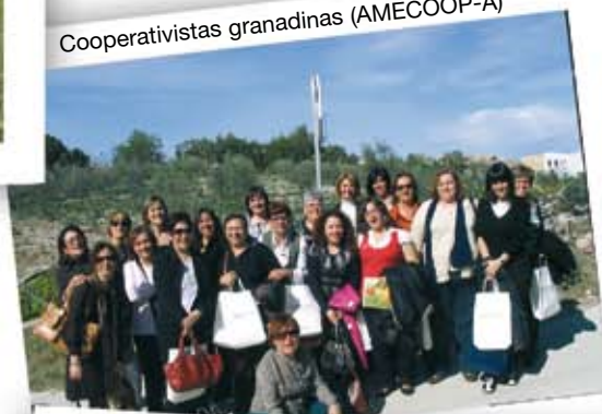
Cooperativistas granadinas (AMECOOP-A)