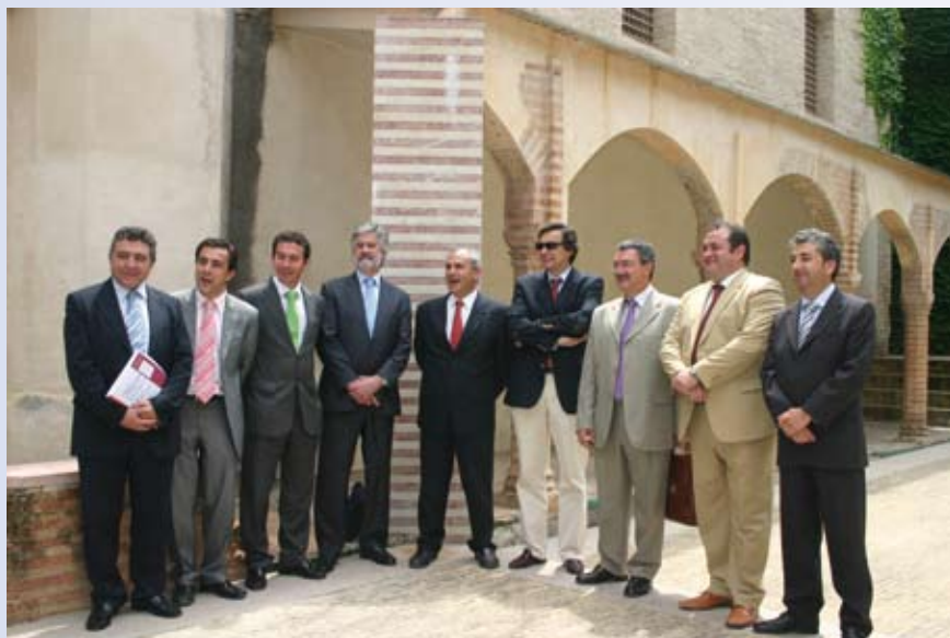
Personalidades asistentes a la semana internacional

de Economía Social y Sostenibilidad (SIESS) donde pudimos acercarnos al cooperativismo latinoamericano, una realidad compleja, variada y rica en matices.