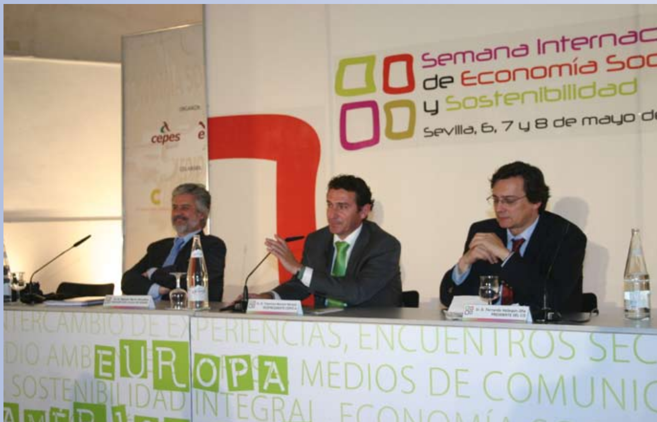
Ponentes de la Semana Internacional celebrada en Sevilla