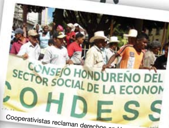
Cooperativistas reclaman derechos en Honduras